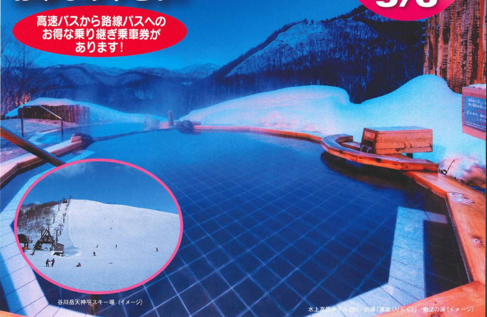
谷川岳天神平スキー場 (イメージ)