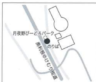
■月夜野びーどろパーク ※路線バス 上河原停留所