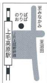
■上毛高原駅(観光協会前)